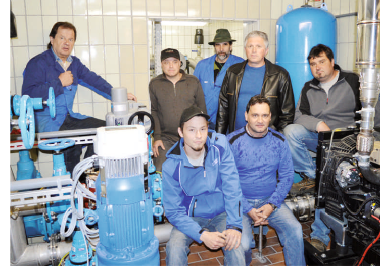
Das Team des Wasserwerks Velden-Schiefling