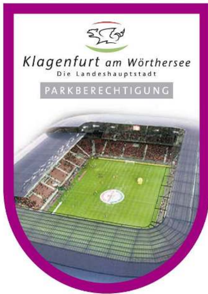
Anlage 2: Abbildung Tages vignette (Parkberechtigung)